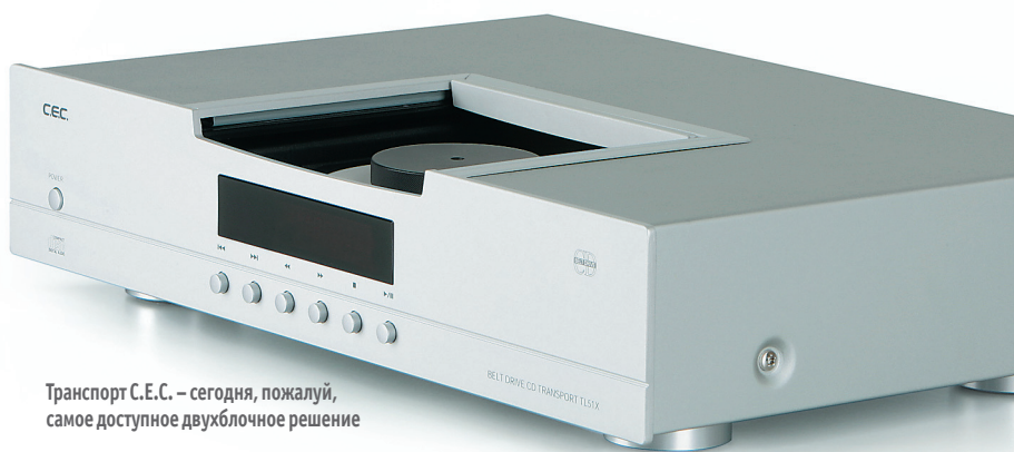
Транспорт С.Е.С. – сегодня, пожалуй, самое доступное двухблочное решение